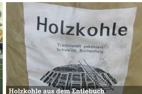
Holzkohle aus dem Entlebuch