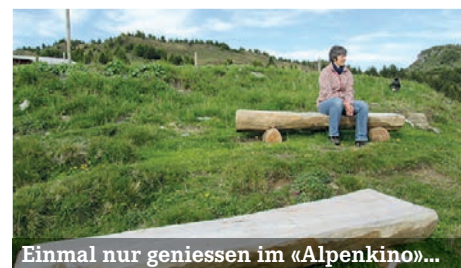
Einmal nur geniessen im «Alpenkino»...