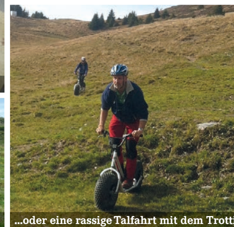
...oder eine rassige Talfahrt mit dem Trotti