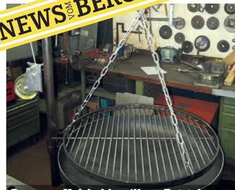
Der neue Holzkohlegrill am Entstehen...