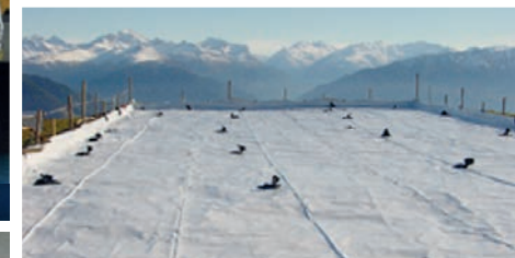
Noch etwas Wasser und dann der Frost...