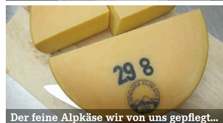
Der feine Alpkäse wir von uns gepflegt...