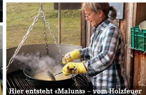
Hier entsteht «Maluns» – vom Holzfeuer