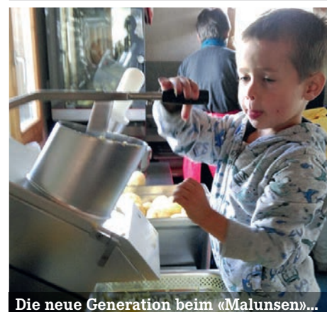
Die neue Generation beim «Malunsen»...