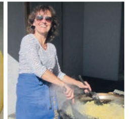
Fleissige Helferin an der Maluns-Pfanne...