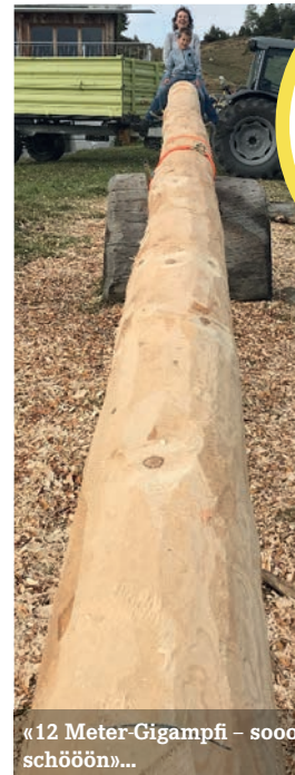
«12 Meter-Gigampfi – sooo schön»...

★ Auf der Speisekarte: Maluns mit Apfelmus und Alpkäs, Hauswurst, Wienerli, Gerstensuppe, Kuchen (plus Tagesspezialitäten) ★