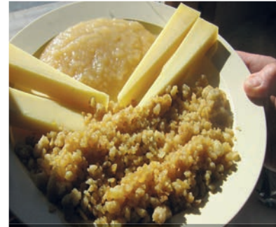
Maluns nach Raguta Art, mit Opfelmues und Alpchäs...