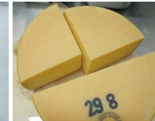
«60 Chäs vo de Alp dil Plaun im Vorratschäller»...