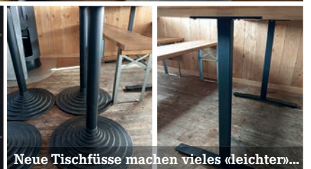
Neue Tischfüsse machen vieles «leichter»...