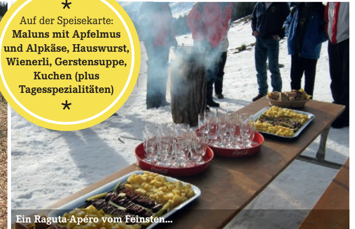
Ein Raguta-Apéro vom Feinsten...