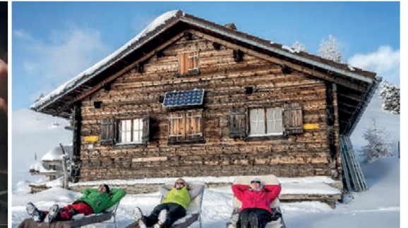
Erholung pur, am schönsten Ort der...

★ Auf der Speisekarte: Maluns mit Apfelmus und Alpkäs, Hauswurst, Wienerli, Gerstensuppe, Kuchen (plus Tagesspezialitäten) ★